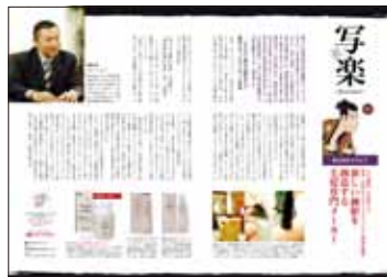
企業紹介企画 「写楽！」