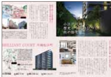
不動産・物件企画 「この街に住みたい」