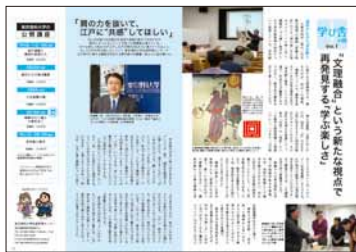
学習講座企画 「学び舎の窓」