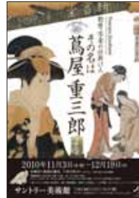
サントリー美術館