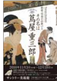
サントリー美術館